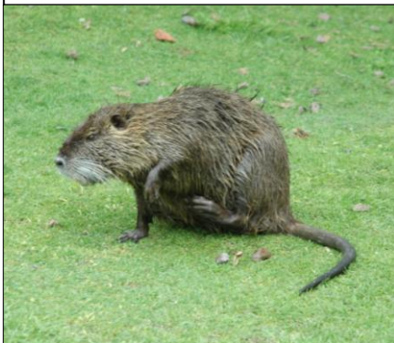
NUTRIA Myocastor coypus