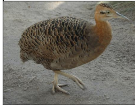
MARTINETA Rhynchotus rufescens