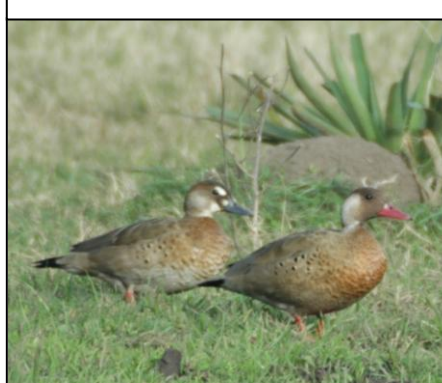
PATO BRASILERO Amazonetta brasiliensis