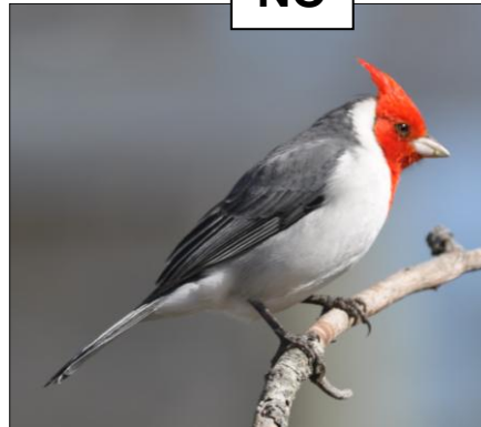
CARDENAL Paroaria coronata