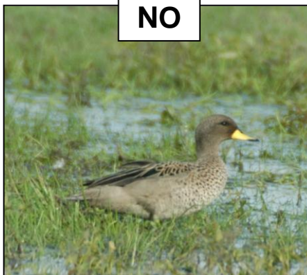
PATO BARCINO Anas flavirostris