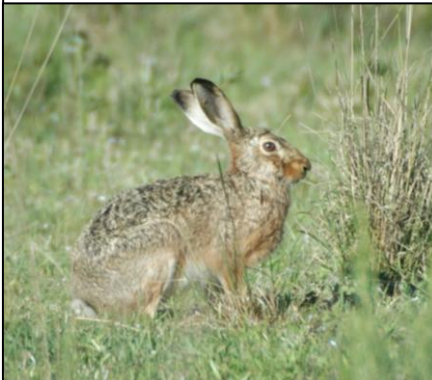
LIEBRE Lepus europaeus