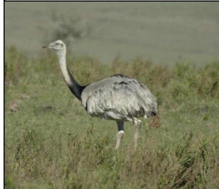
ÑANDÚ Rhea americana