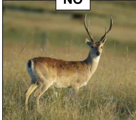
VENADO Ozotoceros bezoarticus