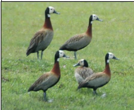
PATO CARA BLANCA Dendrocygna viduata