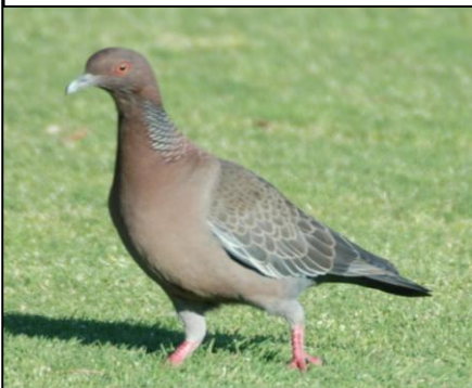
PALOMA GRANDE DE MONTE Patagioenas picazuro