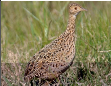
PERDIZ COMÚN Nothura maculosa