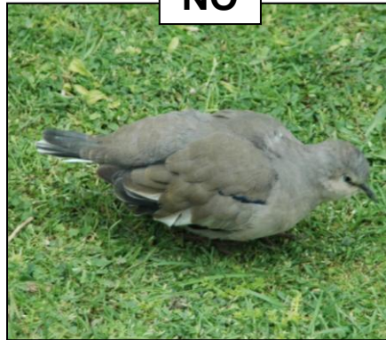
TORCACITA Columbina picui