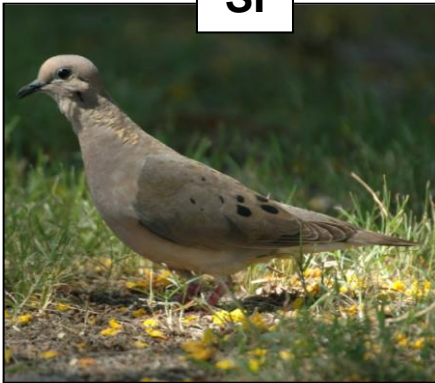
TORCAZA Zenaida auriculata