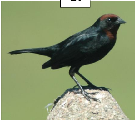
GARIBALDINO Chrysomus ruficapillus