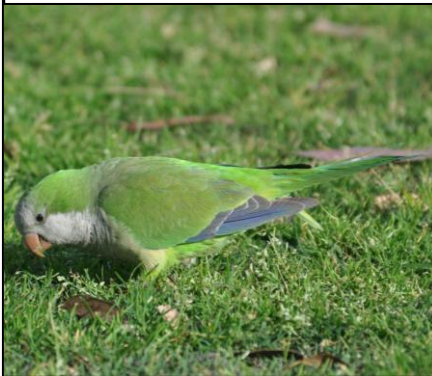
COTORRA Myiopsitta monachus