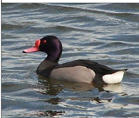
PATO PICAZO Netta peposaca (macho)