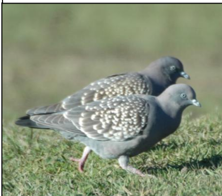
PALOMA ALAS MANCHADAS Patagioenas maculosa