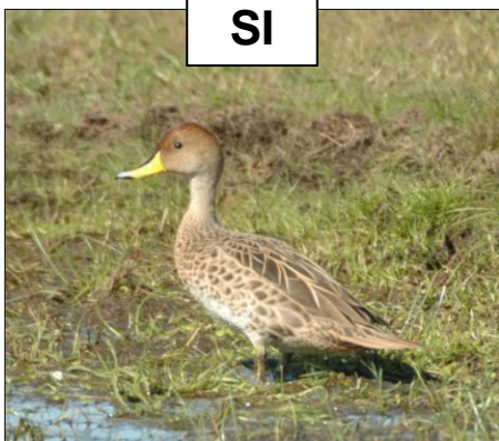
PATO MAICERO Anas georgica