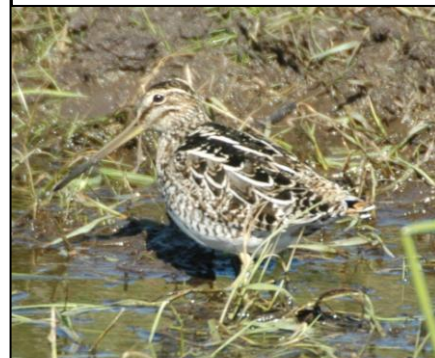
AGUATERO o BECASINA Gallinago paraguaiiae