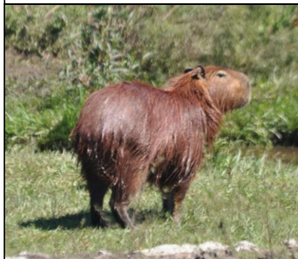
CARPINCHO Hydrochoerus hydrochaeris