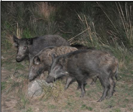
JABALÍ Sus scrofa