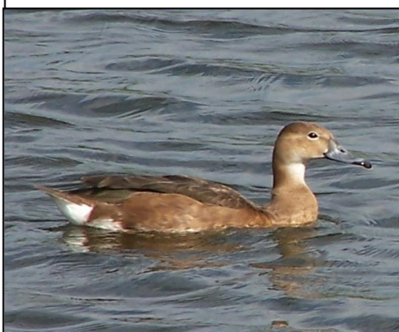
PATO PICAZO Netta peposaca (hembra)