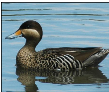
PATO CAPUCHINO Anas versicolor