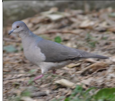
PALOMA ALAS COLORADAS Leptotila verreauxi