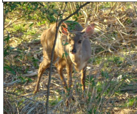
GUAZÚ-BIRÁ Mazama gouazoupira