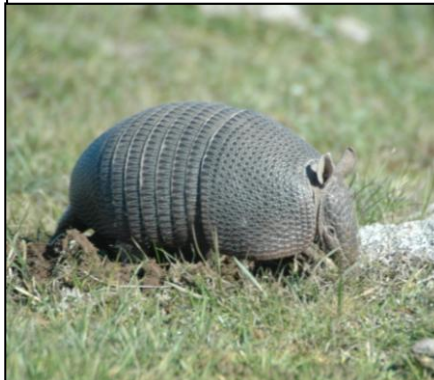
MULITA Dasypus hybridus