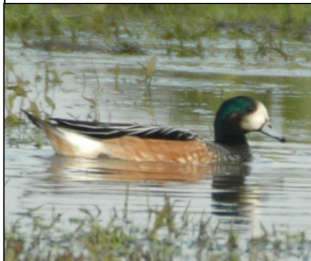
PATO OVERO Anas sibilatrix