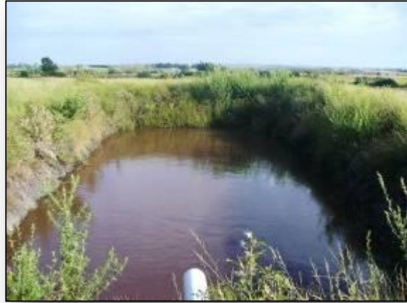
Pileta de almacenamiento de efluentes