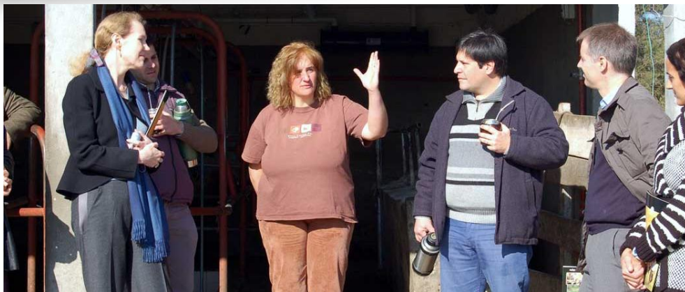
Albana afirma que con el tambo concretó su aspiración de vivir en el campo.