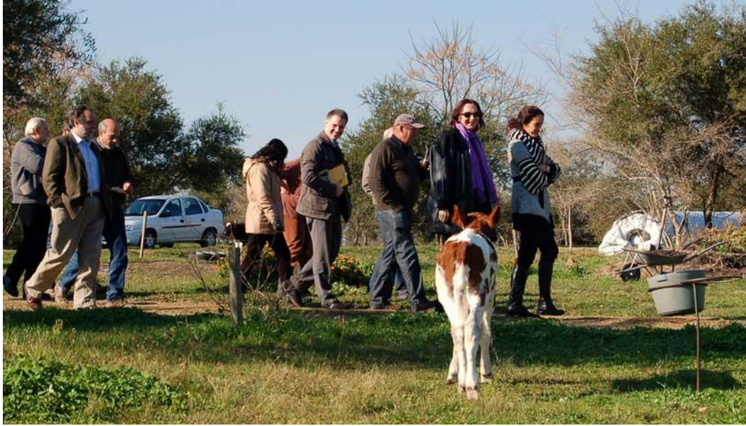
Momento de la recorrida por el predio